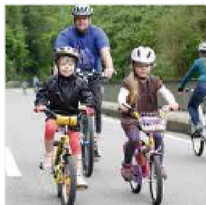
Mobil ohne Auto