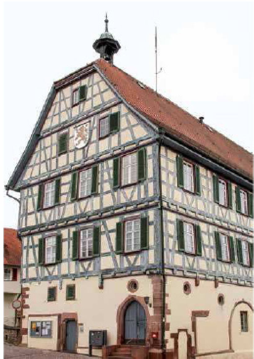
Im Merklinger Rathaus finden die innovativen Gespräche statt